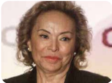
Elba Esther Gordillo