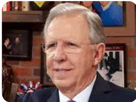
Joaquín López Doriga